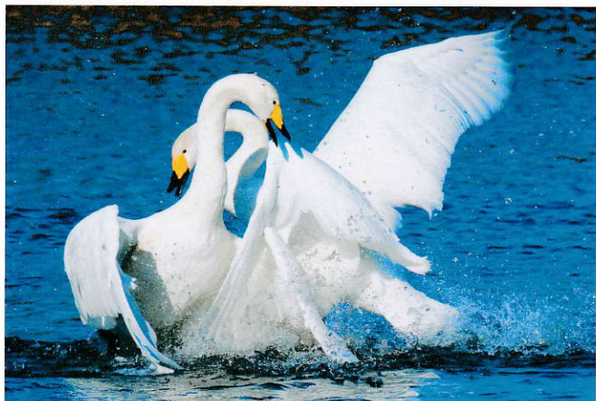
「先制攻撃」